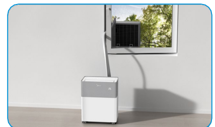
In Betrieb nehmen